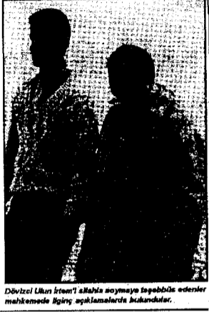
Devlet Üstünlüğüne karşı mücadele edenler mahkemede ilginç açıklamalarda bulundular.

iş yerinden ayrılırken hertürlü tedirginliği ve stresi üzerinde taşıyarak ayrılıyor. Geri döndüğüm zaman herşeyi yerli yerinde bulabilecekmiyim kaygıları ile yaşıyor.