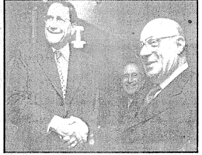
"Alan memnun, satan memnuri"

Tüm bunlar olurken Güney'in ve Kuzey'in emekçileri ölü gözünden yaş beklemeye devam mı edecekler?